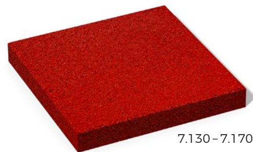
7.130 – 7.170