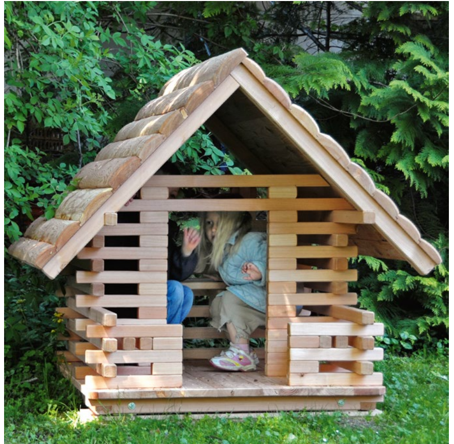
Grere Huser identischer Bauart siehe Katalog „Kind und Spiel“