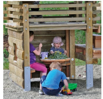
Best.-Nr. L4.10700 Lärche