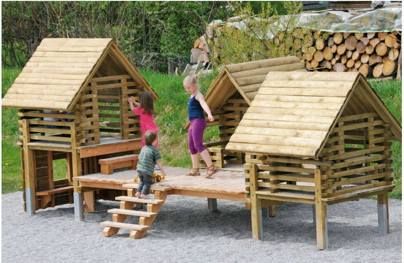
Best.-Nr. 4.10701 imprägniert mit Stahlfüßen