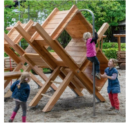
Best.-Nr. 4.16100 Stadtakrobaten Variante 01

Unsere Stadtakrobaten bestehen aus mehreren kleinen Raumelementen, die vielfältige Möglichkeiten zum Verstecken und Durchsteigen bieten. Die anheimelnde Geborgenheit der Nischen gibt Kindern außerdem genug Raum für phantasievolle Rollenspiele. Erklertet werden kann die Konstruktion über einen Steigstamm und ein verbindendes Brückenelement, und an der gebogenen Rutschstange lässt es sich schwungvoll wieder nach unten gleiten.