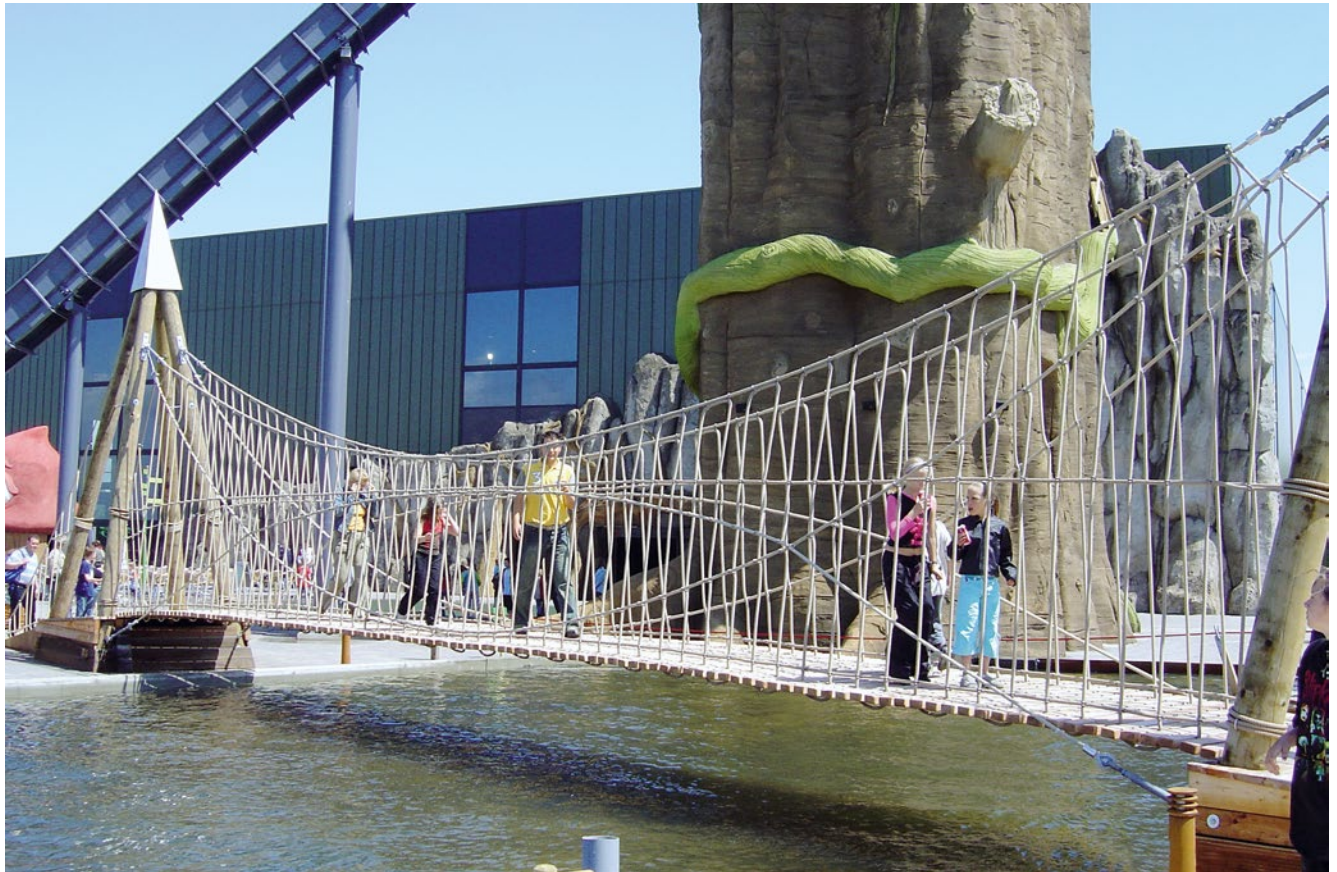
Standardfarbe der Seile rot bei Geländer aus Corocord®-Seil