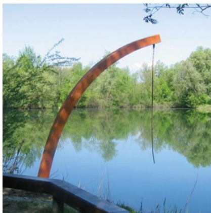
Tarzantau Tarzantau mit Pendelsitz