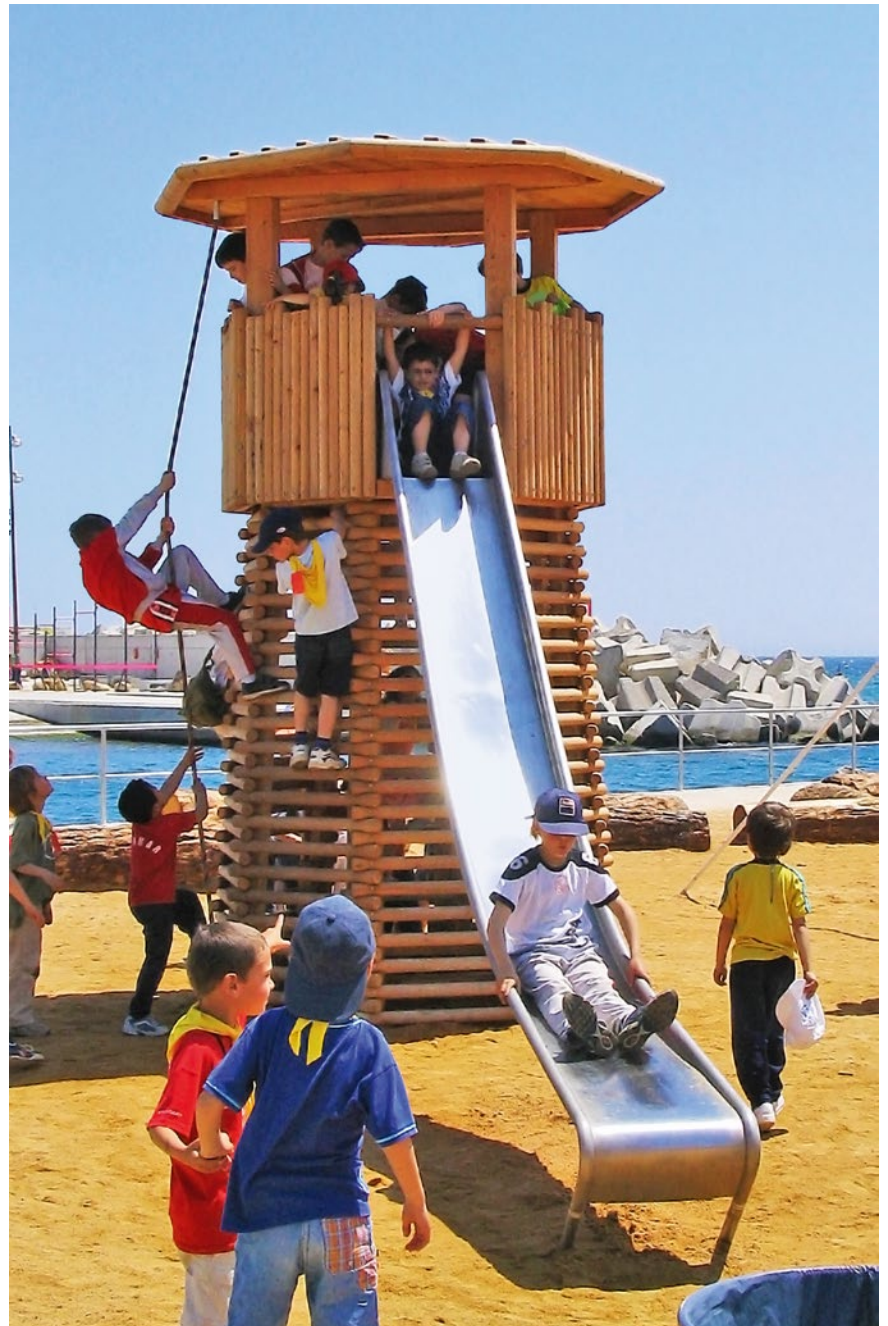
Rutsche siehe Best.-Nr. 3.63520