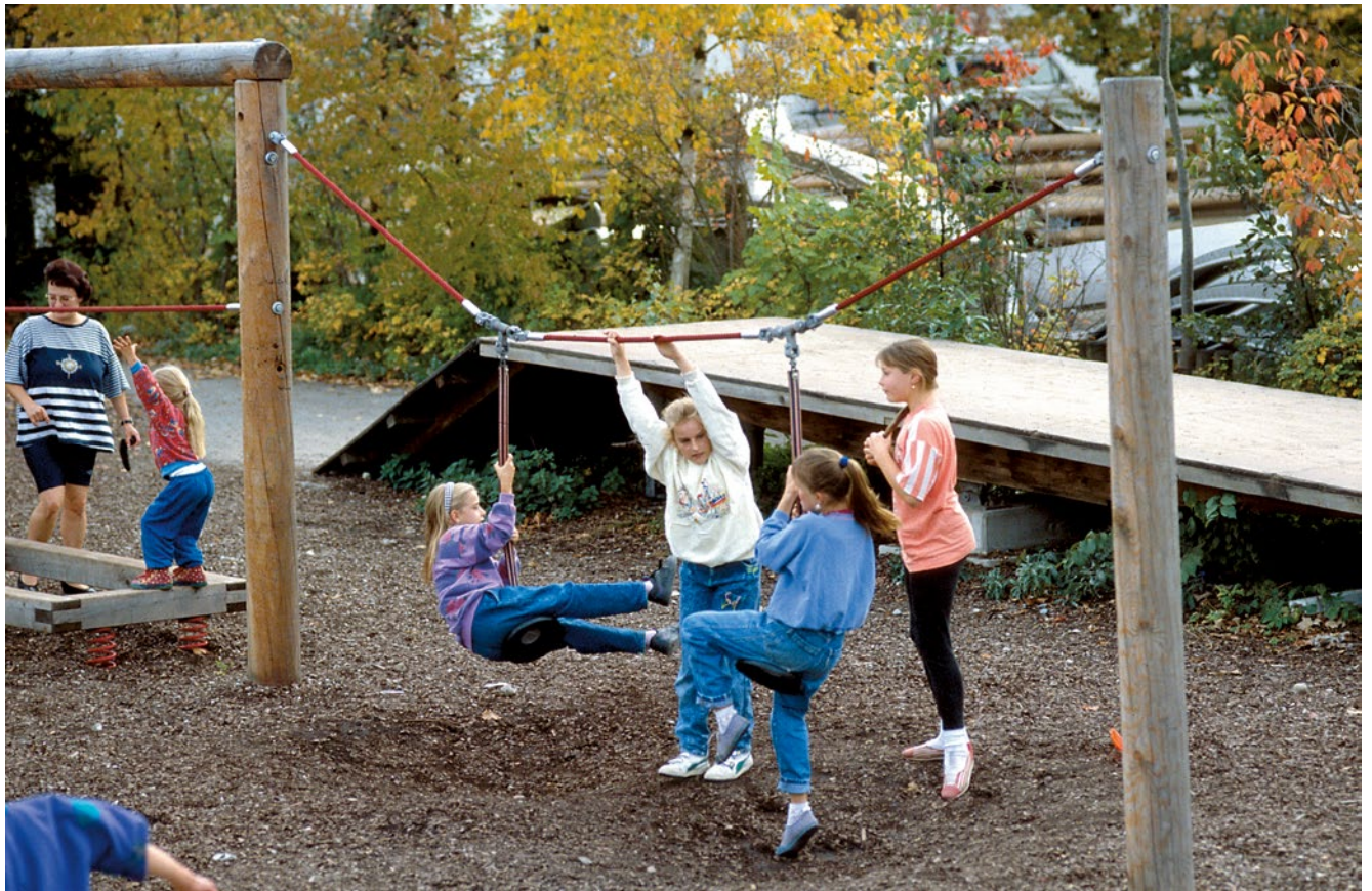
Aufhängung Pendelsitze technisch geändert